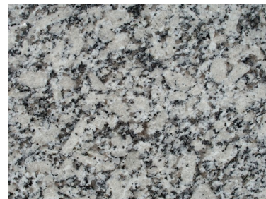
Figura 3 - Puxador Perfil Metálico Embutido modelo1