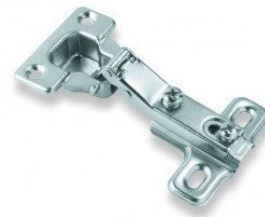
Figura 2 – Dobradiças Metálicas