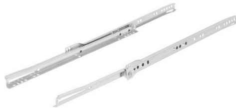
Figura 1 - Corredeiras Metálicas

Sobre o fogão deverá ser instalada coifa elétrica metálica em dimensão compatível com o fogão existente. Aquisição, fixação e instalações elétricas, bem como de duto deverão ser executadas pelo contratado.