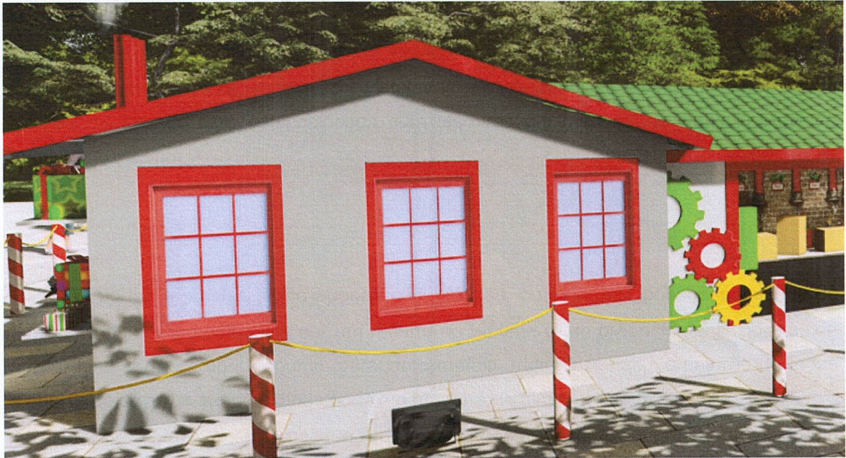
Imagem 04: Janelas com vistas em madeira de pinus pintadas de vermelho

Para o acesso de serviços, que ficará nos fundos da fábrica, deverá ser prevista uma porta com dobradiças metálicas e abertura para passagem de uma corrente ou cadeado.