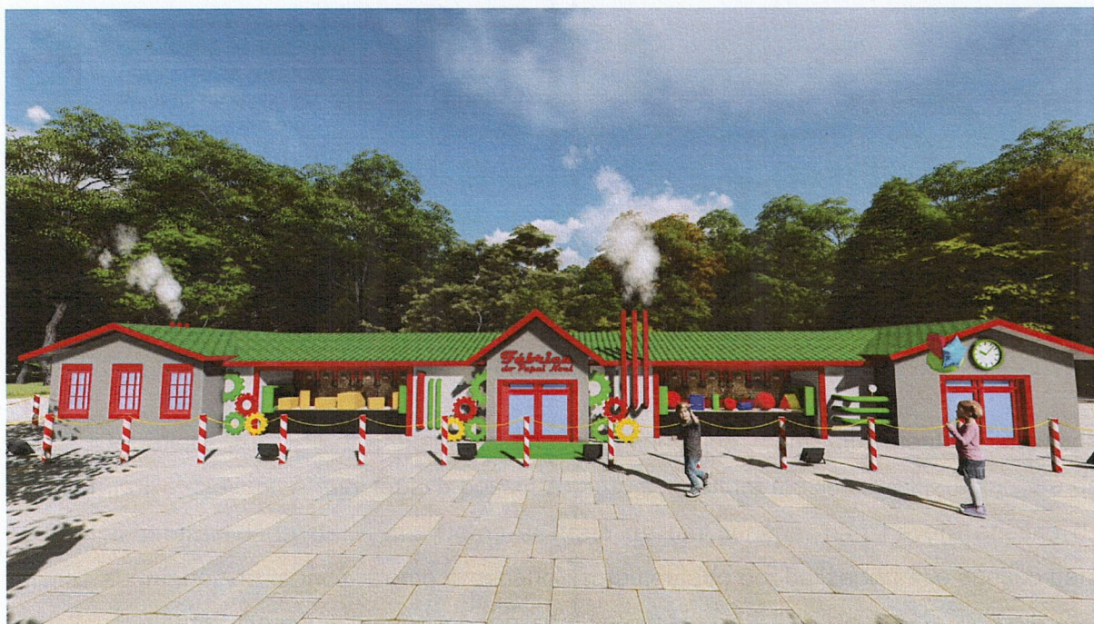
Imagem 01: Vista frontal da Fábrica do Papai Noel

O projeto consiste em uma instalação cenográfica, com movimentos, intitulada Fábrica do Papai Noel. A mini fábrica possui 73,3m 2 , com altura máxima de 2,2m, largura de 18,65m e profundidade de 7,9m. Como se trata de um cenário, não haverá acesso do público ao interior da fábrica. Como o cenário ficará cercado por balizadores, o acesso para manutenção será feito pelos fundos, por pessoal autorizado.