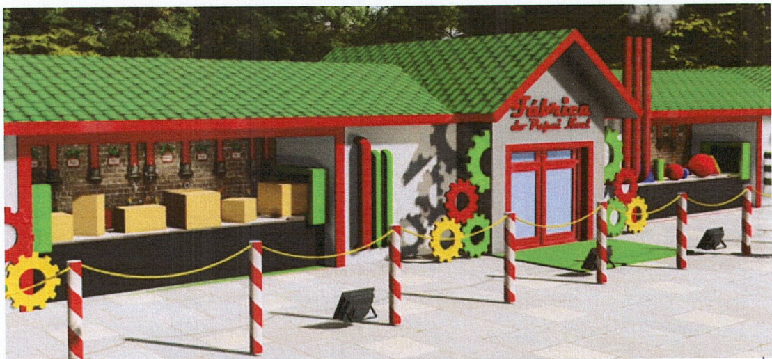
Imagem 06: Elementos decorativos sobre as esteiras

Os objetos decorativos que ficarão sobre as três esteiras deverão ser confeccionados pela empresa contratada. Sobre a primeira, ficarão objetos geométricos coloridos simulando brinquedos; na segunda esteira, caixas de papelão; e sobre a terceira, presentes de tamanhos e estampas diversas.