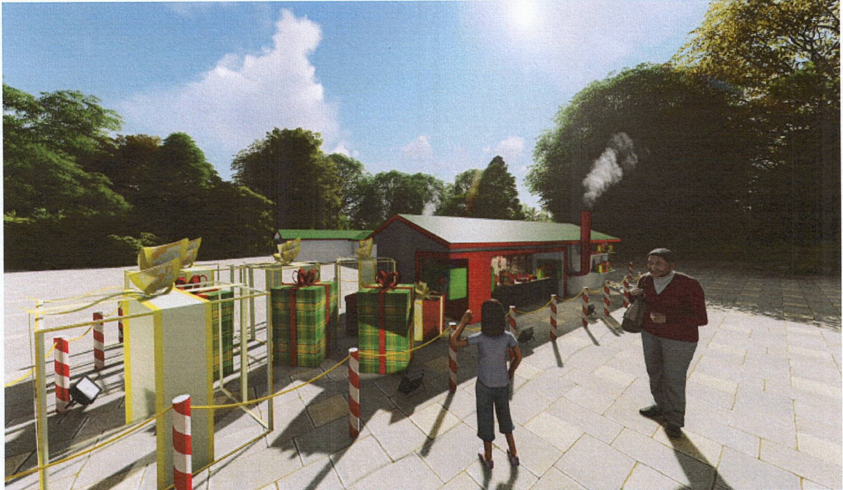
Imagem 02: Esteira com presentes e máquina de fumaça (chaminé)

Estado do Rio Grande do Sul MUNICÍPIO DE ERECHIM PREFEITURA MUNICIPAL Praça da Bandeira, 354 Fone: (54) 3520 7000 99700-010 Erechim – RS