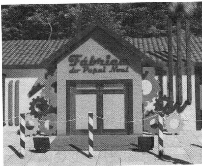
IMAGEM: letreiro instalado na mini fábrica

Estado do Rio Grande do Sul MUNICIPIO DE ERECHIM PREFEITURA MUNICIPAL Praça da Bandeira, 354 Fone: (54) 3520 7000 99700-010 Erechim – RS