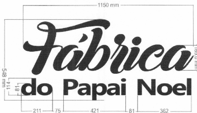
IMAGEM: letreiro Fábrica do Papai Noel

Letreiro em PVC expandido 20mm “Fábrica do Papai Noel”, na cor branca, medindo 1,15x0,55m (largura x altura). Para a produção, será disponibilizado letreiro em CorelDraw, além de fontes e demais especificações. O letreiro deverá ser retroiluminado, portanto é de responsabilidade da empresa a colocação de fita LED apropriada para uso externo, de temperatura 3000K na parte traseira do letreiro. O letreiro deverá ser entregue no pavilhão do Natal e aprovado pelo gestor.