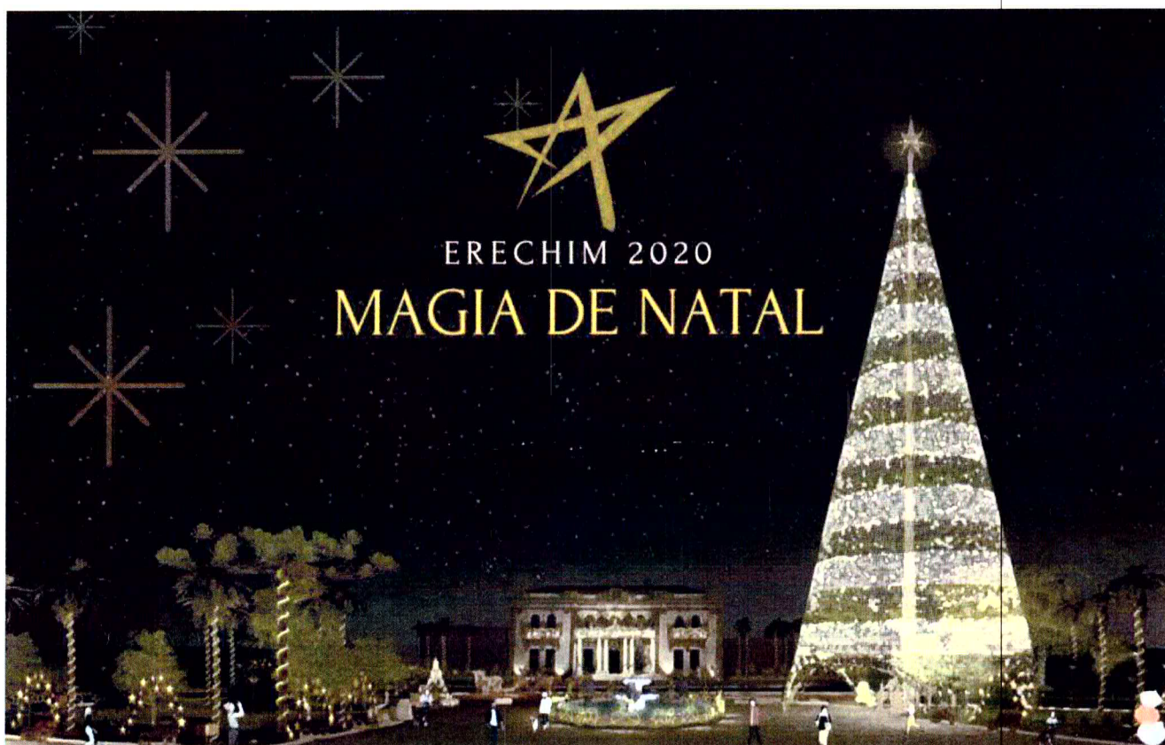
IMAGEM: Magia de Natal