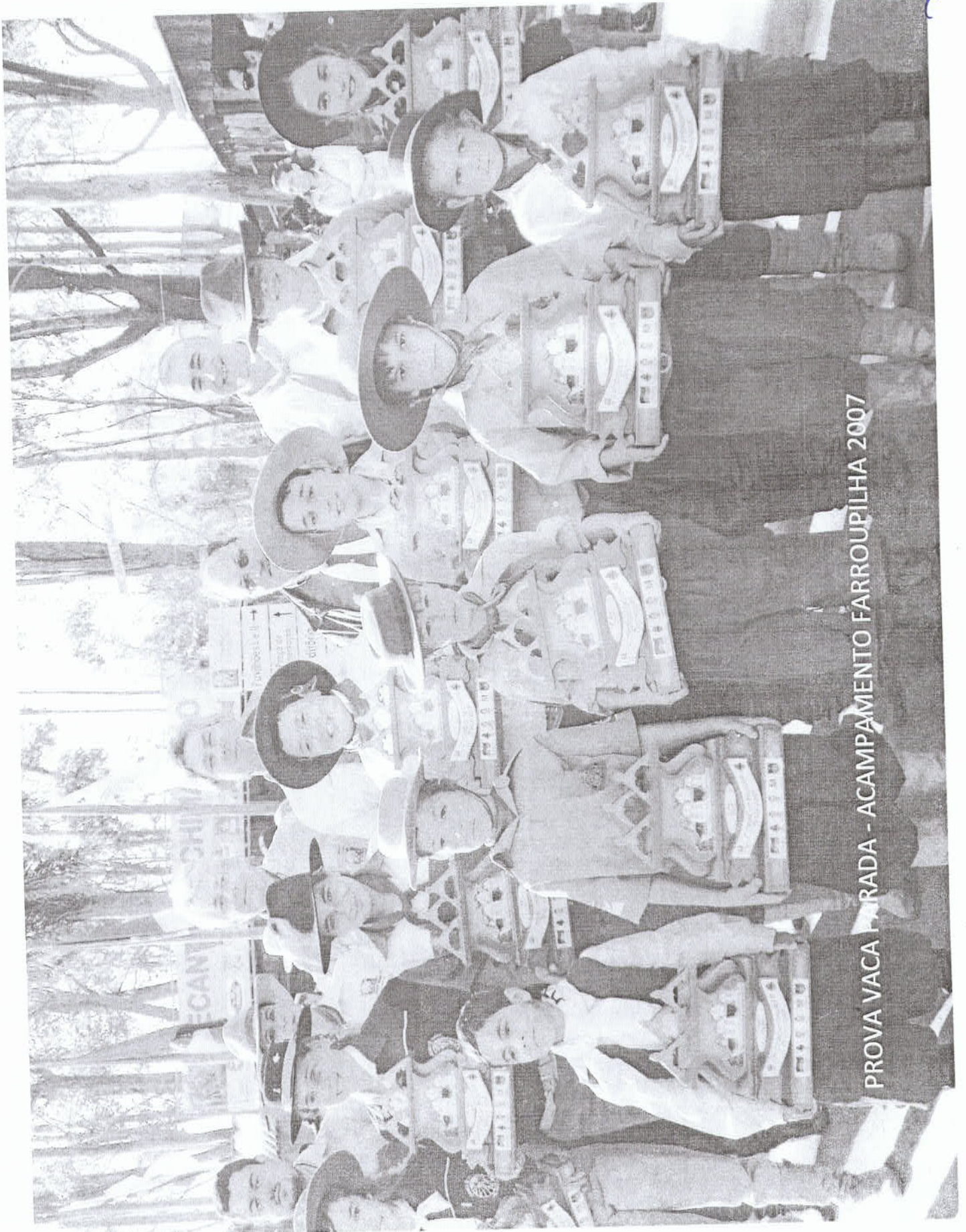
PROVA VACA PARADA - ACAMPAMENTO FARROUPILHA 2007