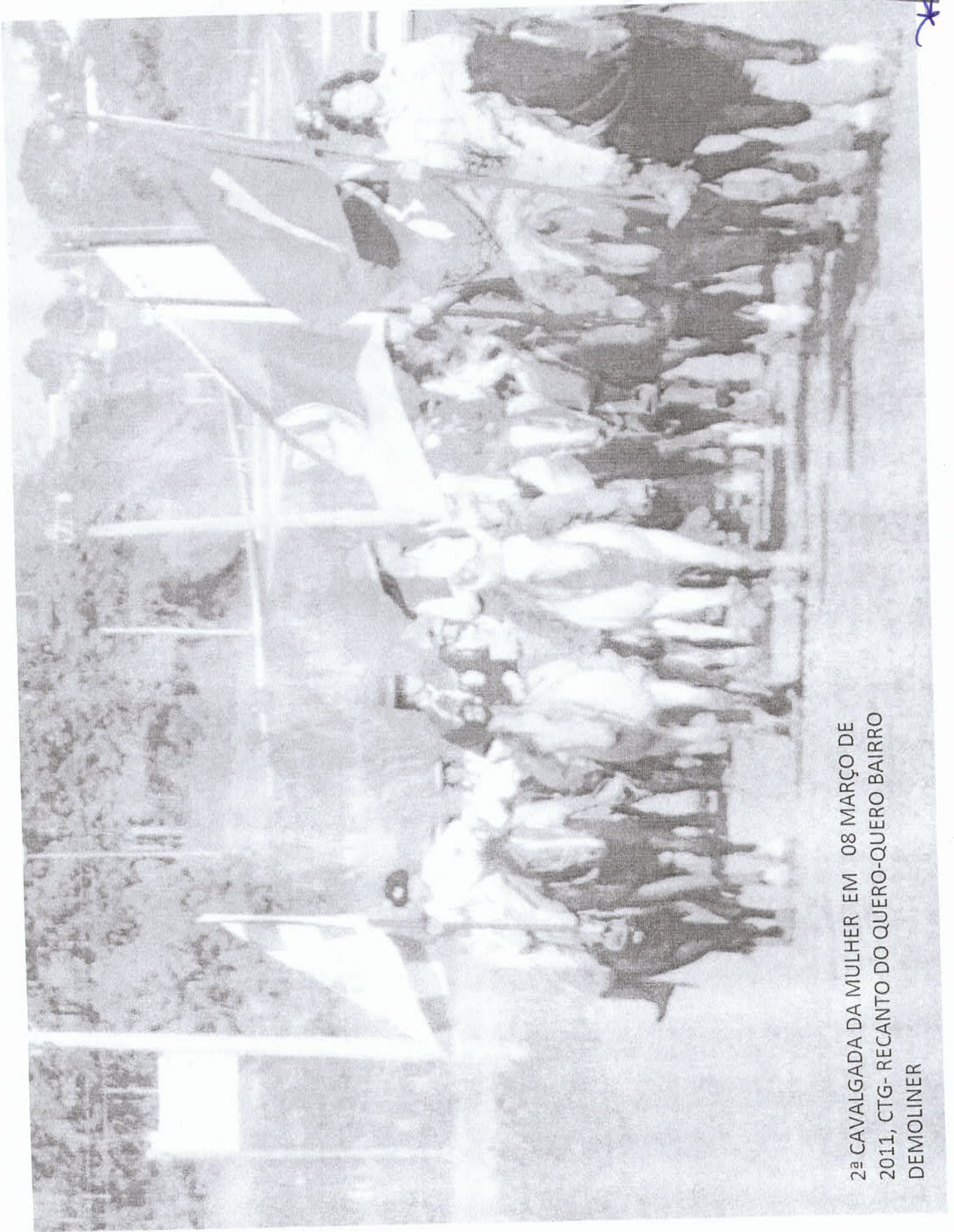
2ª CAVALGADA DA MULHER EM 08 MARÇO DE 2011, CTG- RECANTO DO QUERO-QUERO BAIRRO DEMOLINER