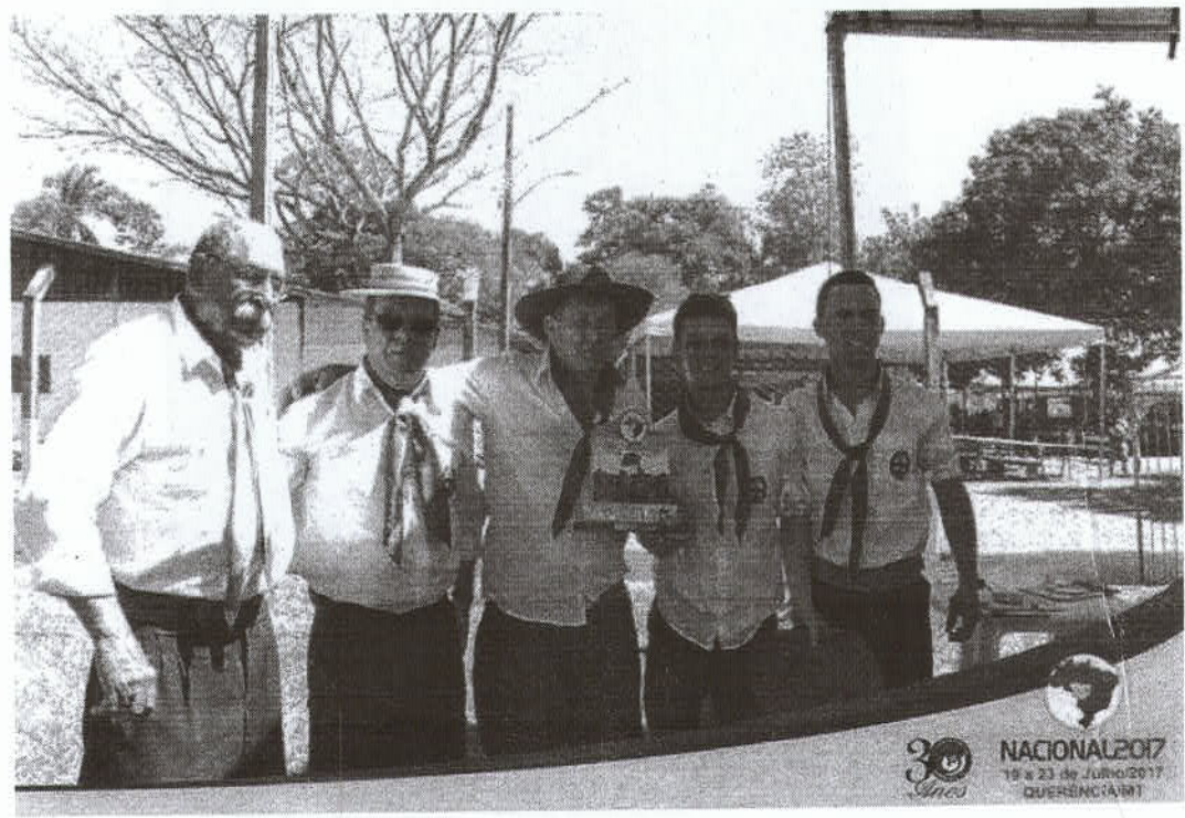
CTG RECAQNTO DO QUERO-QUERO CAMPEÃO NACIONAL 2017 DA BOCHA CAMPEIRA