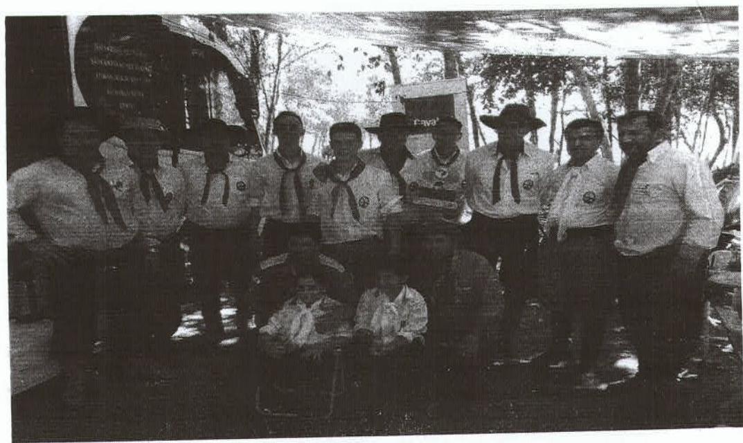
EQUIPES DA 19ª RT